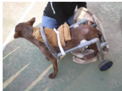
配上輪椅走起來方便多了

關懷的力量真的很大，漸漸的，小咖啡越走越順了。即便後腳還是有點跛，偶而還會在沒學生的傍晚或晚上，自己站起來，到前庭繞一圈，到中庭、操場繞一圈，好像又要上工巡邏警戒去了。我們慶幸當初並未放棄小咖啡，也十分感謝醫生精湛的技術，讓小咖啡復原得那麼好。小咖啡真的很勇敢，很厲害，更用辛苦的代價，為大家上了一堂珍貴的生命教育課程。