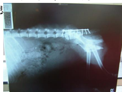
手術後 X 光照