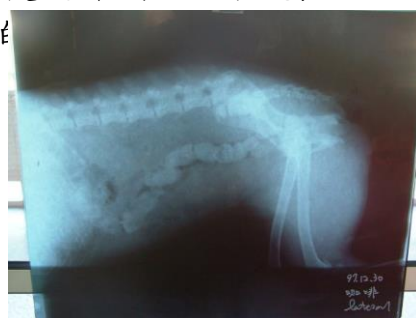
受傷時 X 光照

給學校帶來平靜與歡樂，紛紛主動關心詢問，並捐輸醫療費用，許多小朋友們知道了，也主動的說要捐零用錢給小咖啡醫療用。也許牠感受到大家的關心了，也許牠還年輕，生命力旺盛，慢慢的，每次去探望牠，都有一些進步。發現他的腳會動了，腳底神經有反應了，是第一個令人振奮的好消息，之後每次的探望都有一些驚喜。隨著時間累積，進步到會站了，接著會坐了，接著會排