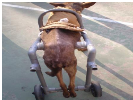
官老師為小咖啡找來了輪椅